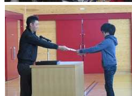
PTA会長さんより記念品をいただきました