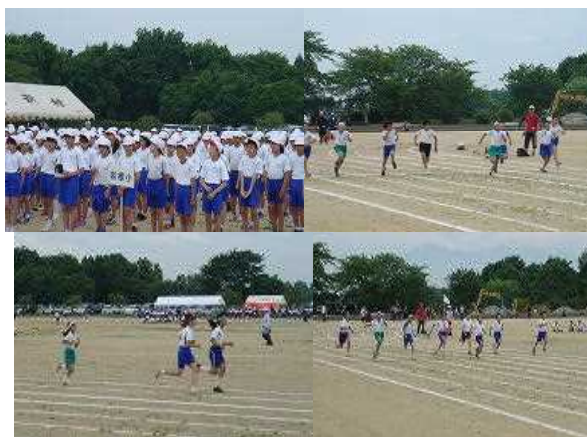
南達陸上大会から(5/25)→