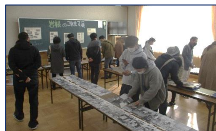
岩根の歴史に触れて

創立 150 周年を記念して、PTA 主催の「 岩根のこれまで展 」を学習発表会と同時催で行いました。学習発表会の幕間に、多くの方が展示室に足を運び岩根の歴史に触れていました。保護者の中にも岩根小出身の方が多くいらっしゃるの、小学校時代の自分の写真を見ながら、当時を懐かしそうに振り返られていました。資料についてはもう少しお借りし、子どもたちにも見せ、岩根の歴史を感じられるようにしていきます。