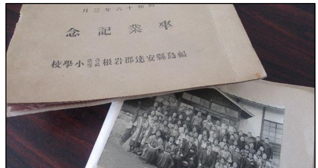
80年以上も前の思い出が詰まっていました。

写真から当時の様子を知ることができます。いつか、お披露目する機会を持ちたいと思います。皆様のお宅にも貴重なお宝はありますか？