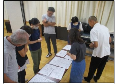
力作ぞろいの標語を審査

選ばれた標語は、どの作品も力作ぞろいで甲乙つけがたかったのですが、最終的に、以下の標語が選ばれました。