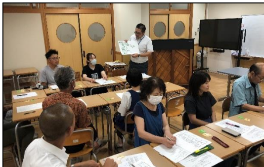
率直に考えを伝え合う「熟議」

この「熟議」という言葉、聞き慣れないかもしれませんが、「学校と地域住民で『熟慮』と『議論』を重ねながら課題解決をめざす対話」のことで、活発な議論により、的確に多くの人の意見を反映することを目指しています。少しでも言いかたをすれば、「子どものために