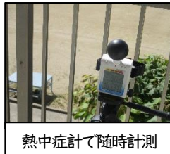
熱中症計で随時計測

学校では、室内の温度調整、定期的な水分補給の指示等をしながら、お子さんの体調管理に努めています。また、熱中症警戒アラートに基づき、校庭や体育館での活動を制限しながら、健康面に留意をしているところです。