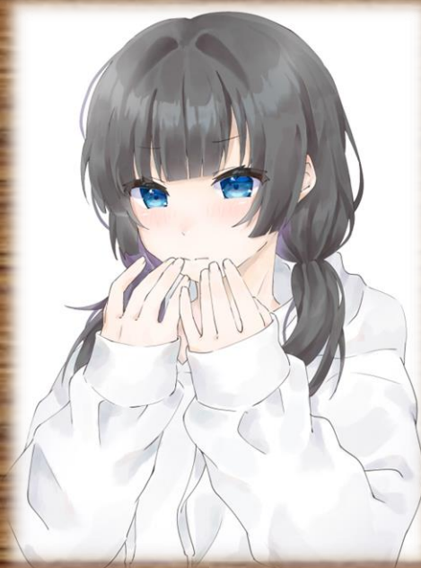
ペンネーム…たろうまる