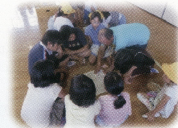
見守り隊による登下校安全教室