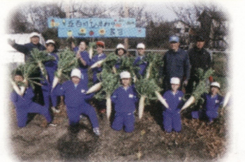
農業クラブ 大根の収穫