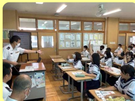
自衛隊による職場講話（8月）

地域とともにある学校を図るため、学校運営に地域の声を積極的に生かし、地域と一体となって特色ある学校づくりを進めております。皆様、ご理解とご協力のほどよろしくお願いいたします。