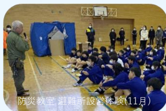
防災教室 避難所設営体験(11月)