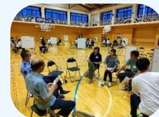
岩根の子どもを考える会(6月)

今予測不可能な時代となり、デジタル化が進む中、私たちは地域の皆様と共に進化し、子どもたちに合った地域のコミュニティを作っていきたい。