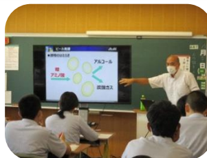
企業による出前授業 「職業人に聞く」の様子