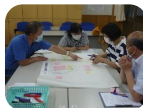
学校運営協議会 熟議の様子